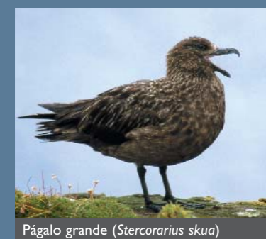
Págalo grande ( Stercorarius skua )

Estas zonas favorables pueden coincidir con áreas de gran riqueza en nutrientes, hábitats como los bancos de arena, desembocaduras de ríos, o caladeros pesqueros. A menudo estas zonas coinciden con focos de alta diversidad de invertebrados, peces, tortugas, cetáceos y, por supuesto, aves.