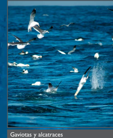
Gaviotas y alcatraces