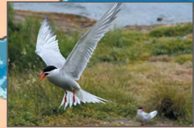
Charrán común ( Sterna hirundo )