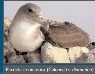
Pardela cenicienta ( Calonectris diomedea )