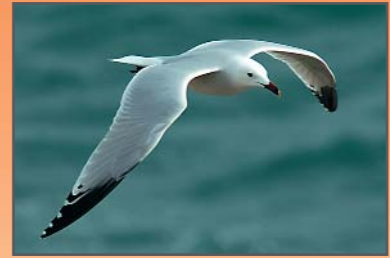
Gaviota de Audouin ( Larus audouinii )