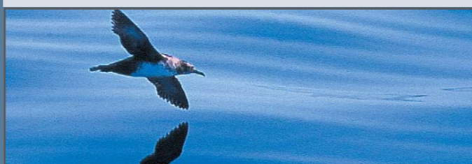
Pardela balear ( Calonectris diomedea )

SEO/BirdLife desarrolla el proyecto LIFE Áreas Importantes para las Aves (IBA) marinas en España, que tiene por objetivo elaborar un inventario detallado de IBA marinas en España, así como identificar las amenazas a las que se enfrentan las aves marinas y elaborar planes de gestión adecuados para garantizar su protección. El Ministerio de Medio Ambiente es cofinanciador del proyecto, que cuenta también con el apoyo del Ministerio de Agricultura, Pesca y Alimentación, Comunidades Autónomas con competencias en el ámbito marino e instituciones como el Instituto Español de Oceanografía, la Universidad de Barcelona y el Instituto Mediterráneo de Estudios Avanzados.