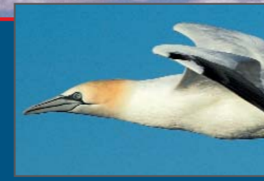
Alcatraz atlántico ( Morus bassanus )